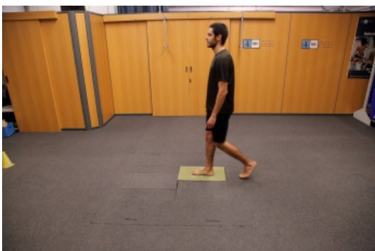
Imagen 1. Sistema de análisis de la marcha NedAMH

En esta prueba se valora el patrón cinético (fuerzas de reacción que ejerce el miembro inferior) durante la fase de apoyo de la marcha humana. El sistema de valoración utilizado es el NedAMH/IBV , que consta de una plataforma dinamométrica, dos barreras de fotocélulas para el registro de la velocidad y una aplicación informática para el registro y análisis de resultados. Para llevar a cabo la valoración compara los parámetros obtenidos en ambas extremidades con una base de datos de normalidad integrada por personas con características comparables a las del paciente caminando a su misma velocidad (base de datos elaborada por el IBV, segmentada por edad, género y presencia de calzado).